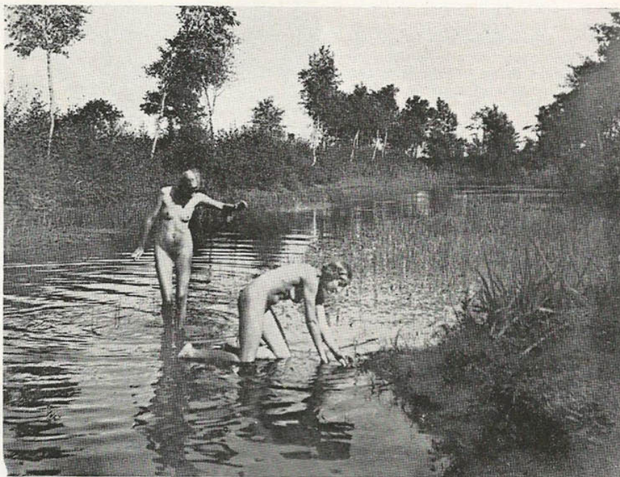
Naturismo d'altri tempi